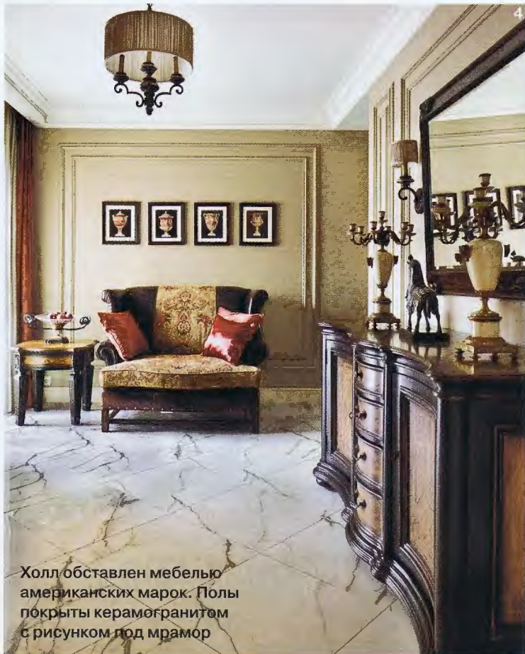
Холл обставлен мебелью американских марок. Полы покрыты керамогранитом с рисунком под мрамор

Несмотря на сочетание различных стилей, культур и эпох, интерьер дома получился удивительно цельным и гармоничным. Это наполненное светом и цветом жилое пространство, в котором комфортно всем членам семьи и их многочисленным гостям. □