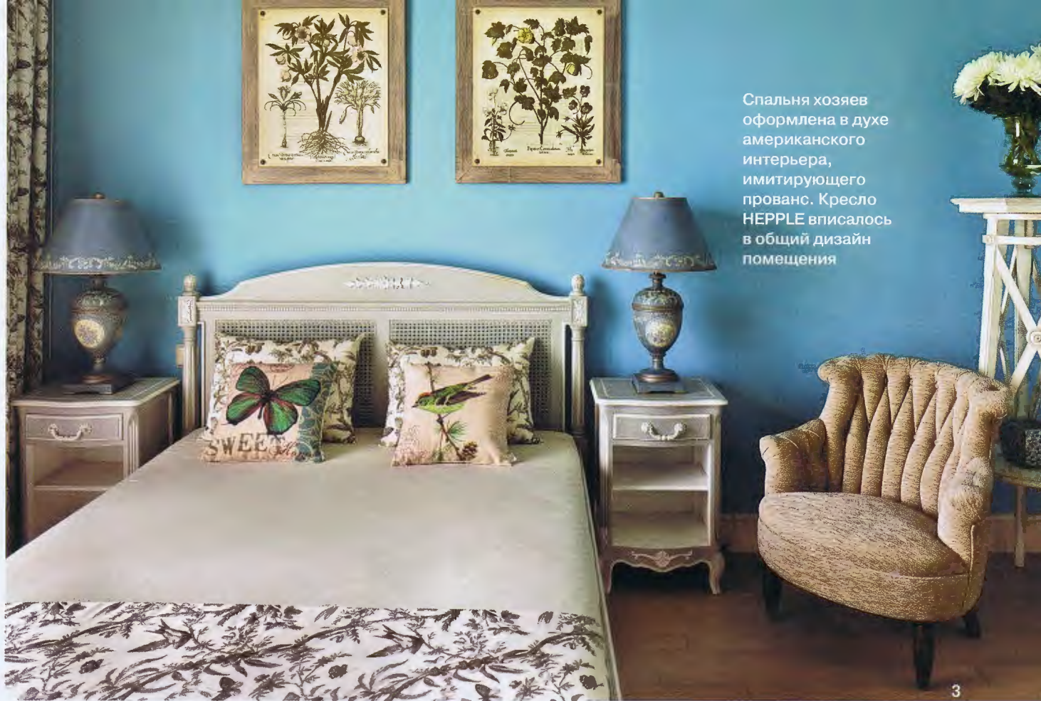
Спальня хозяев оформлена в духе американского интерьера, имитирующего прованс. Кресло HEPPLE вписалось в общий дизайн помещения